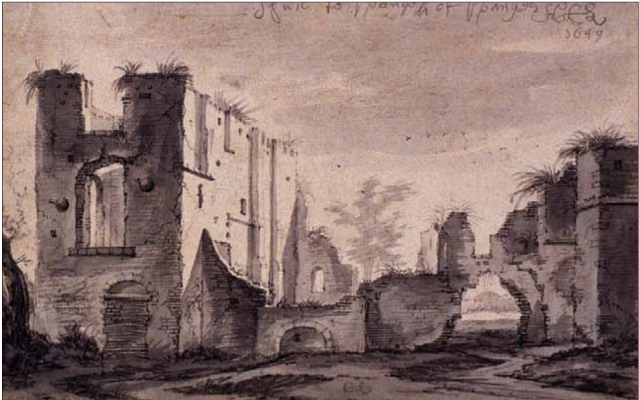
Ruïne van kasteel Ter Spangen in 1649. Tekening vervaardigd door C. Saffleven.