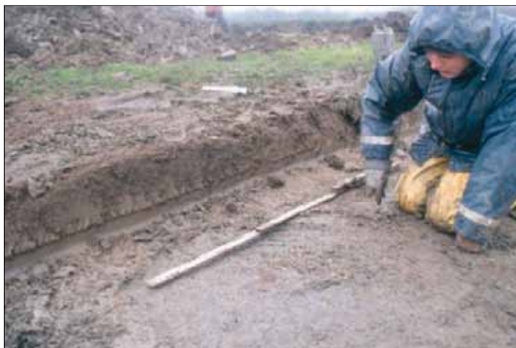
Opgraving van een crematiegraf uit de Romeinse tijd in het herinrichtingsgebied 'De Kandelaar'. De sporen bevinden zich vlak onder het maaiveld.

Tekening van de plattegrond van een boerderij uit de Romeinse tijd, die in 2003 werd opgegraven in het herinrichtingsgebied 'De Kandelaar'. De boerderij bestaat uit drie delen: een noordoostelijk deel dat, gezien de aanwezigheid van een haardplaats, als woondeel kan worden opgevat. Het middendeel, met resten van stalboxen en dikke pakketten mest, werd voor de stalling van veen gebruikt. Het gedeelte aan de zuidwestzijde betreft waarschijnlijk een latere uitbreiding van het gebouw. Schaal 1:250.